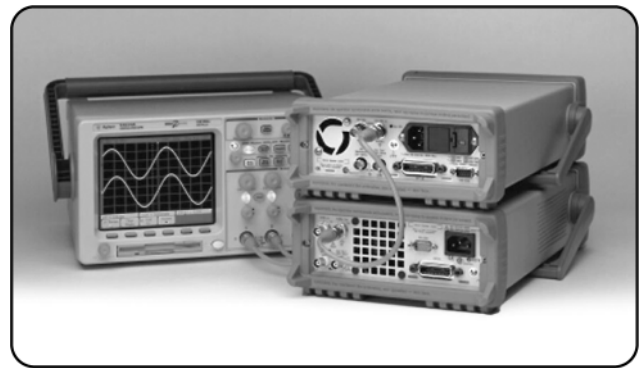
图 1: 33120A (上) 接受来自 33250A (下) 的外基准信号

如果您需要组合多台 33120A，就需要添加可选的外基准和为每台发生器配背的接受外基准的 BNC 连接器。如果您已有 33120A，可查看后面板“Ext Ref In”和“Ref Out”这两个标记下面是否有可选的 BNC 连接器。如果您的 33120A 没有安装选件 001，通常可对它进行重装。请在 Agilent 网站上了解重装该选件的细节。用网址上的搜索引擎寻找部件号 33120-80001。